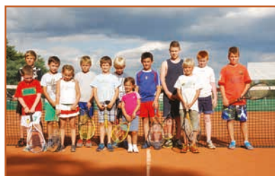
Stage de Juillet

Renseignements auprès de Mme Karine FARNY Tél. : 03 69 19 00 76.