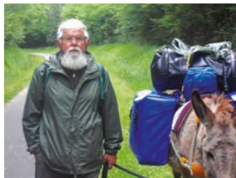
Escale montagnarde pour les deux marcheurs

Cécile Fellmann (L'Alsace du 25.11.2015)