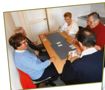
Un autre groupe reste concentré...