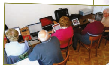
Initiation à l'ordinateur et aux tablettes