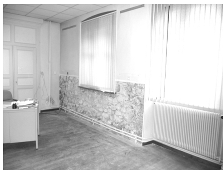
Le secrétariat avant les travaux

Enfin terminé, le nouveau secrétariat de mairie ! Enfin de l'air et de l'espace pour secrétaires et comptable, et