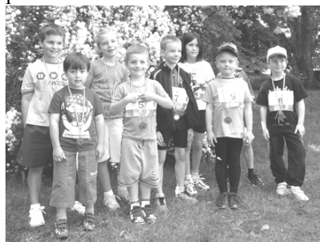
Les concurrents de la catégorie "Ecole d'Athlétisme"